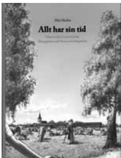
Bokomslaget är signerat Pål Jansson.

Till boken finns en hemsida med bl. a. ett personregister. Adress till hemsidan: www.lenfre.se/alltharsintid