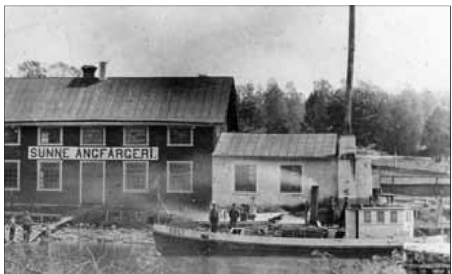
På Torvnäsområdet fanns Sunne Ångfärgeri.