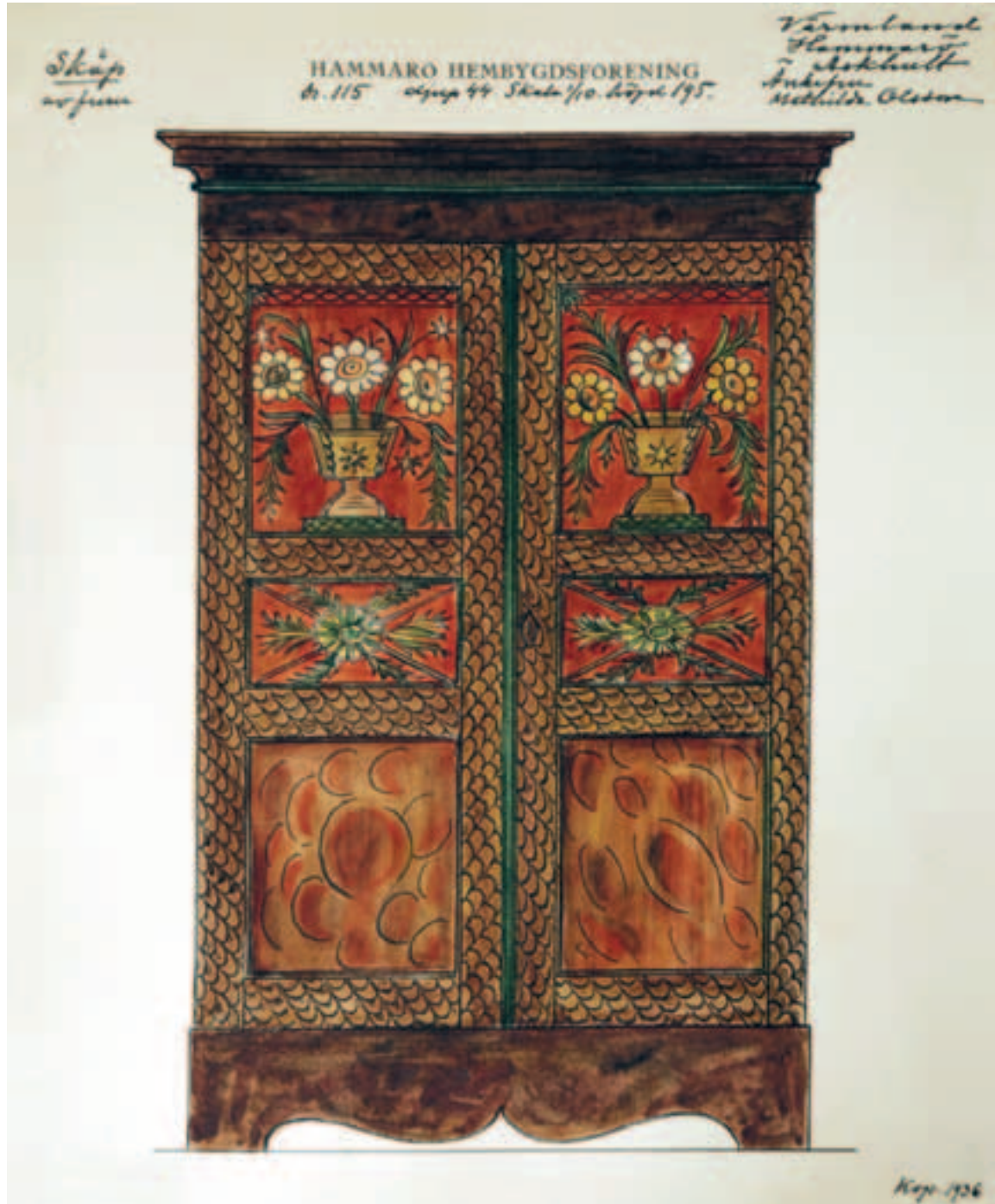
Skåp av furu, Hammarö, Askhult, änkefru Mathilda Olsson. Avmålat av Sigrd Kjellin 1936.