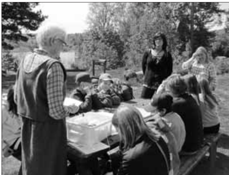
Eleverna från Roveruds skola.

DET VAR LAGOM VARMT, en vacker dag och alla verkade trivas. Barnen var pigga och intresserade. Pedagogerna underlättade förståelsen med ett och annat ord på norska. Det är inte lätt att skilja råg från lin än värre roggan från