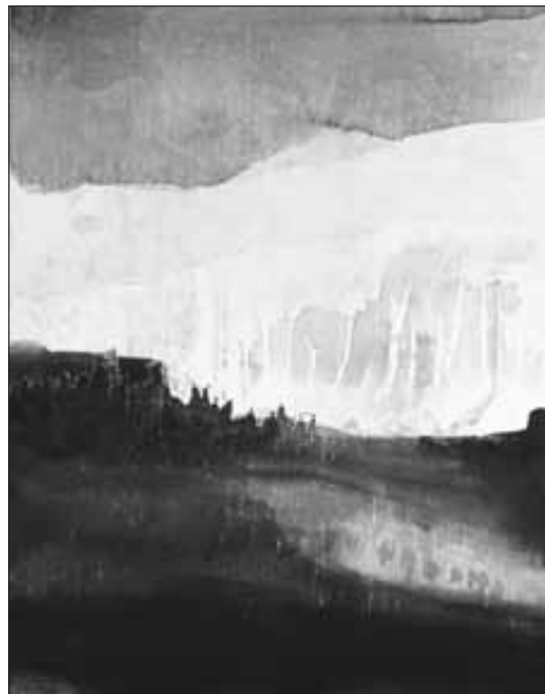
Gao Xingjian, tuschteckning.

Himlens fäste är ett sinnestillstånd. Kliv in i världen mellan pärmarna och lev med! ☺