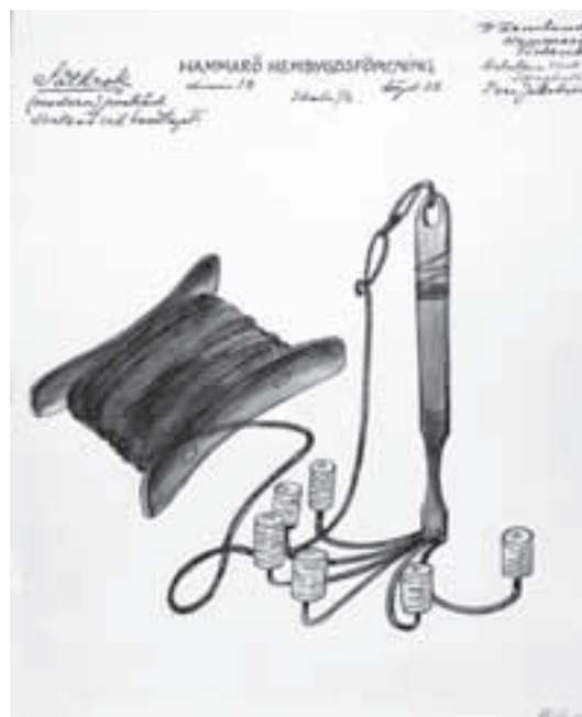
Såtkrok, (modern) järntråd svetsad vid handtaget. Hammarö, Fiskevik, arbetare vid Skoghall Ivar Jakobsen.