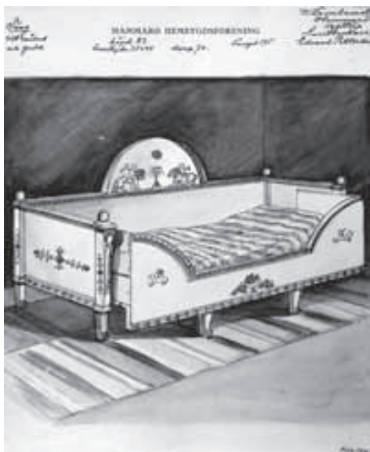
Säng av furu. Hammarö, Helltorp, Lantbrukare Edvard Pettersson.