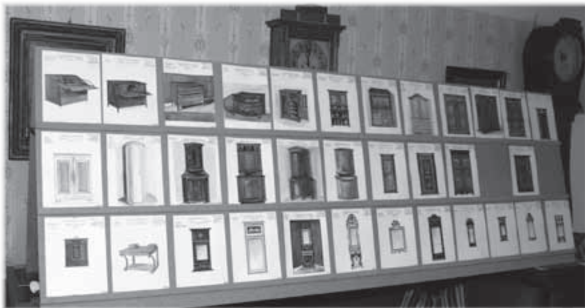
Från Hammarö hembygdsförenings utställning hösten 2011, som Solweig Nyström arrangerat.

samlingsplats. Männerna snickrade och lagade möblerna som fruarna tvättade rena. Onsdags- och lördagskvällarna samlades de till detta arbete. Materialet från Hammarö omfattade även ett stort antal speglar, då snart sagt varje hem gömmer någon, kanske en fästmansgåva eller brudgumspresent.