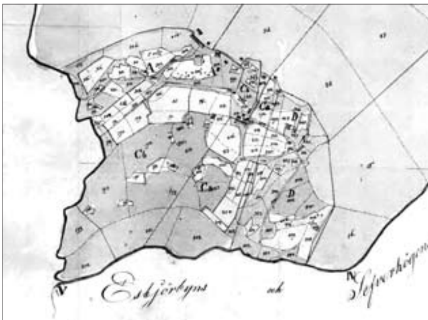
Laga skifteskartan över Ärtviken 1841.

Personerna lever dock kvar genom mitt och andras intresse, och deras gårdar genom de historiska kartorna. Mina släktingars kulturgeografi fascinerar mig till den grad att jag håller på med en krönika om deras liv och rörelser i rummet. I den krönikan kommer kartorna att spela stor roll, både relaterat till platsernas historia och personernas rörelser. 🐦