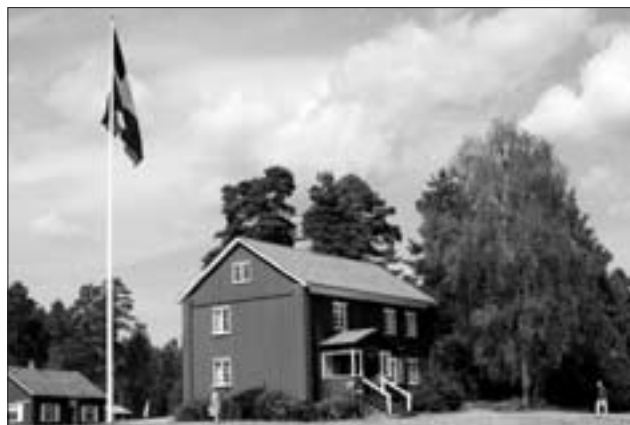
"Västre i Strand". Brunskogs hembygdsgård.

Därefter blir det dags för det första stora evenemanget, nämligen vår Hantverksmessa, som hittills samlat ca 140 utställare av gediget och prima hantverk. I år pågår den 27 juni till 29 juni. Under lördagen anordnas en klädparad, där vi visar upp kläder från de olika utställarna, vilket brukar vara mycket uppskattat. På söndagen skall vi även i år anordna en internationell och gränsöverskridande folkdräktsparad. Vi gjorde ett försök ifjol (se bilder i Näverluren nr 4 år 2007), som blev mycket lyckat. För våra