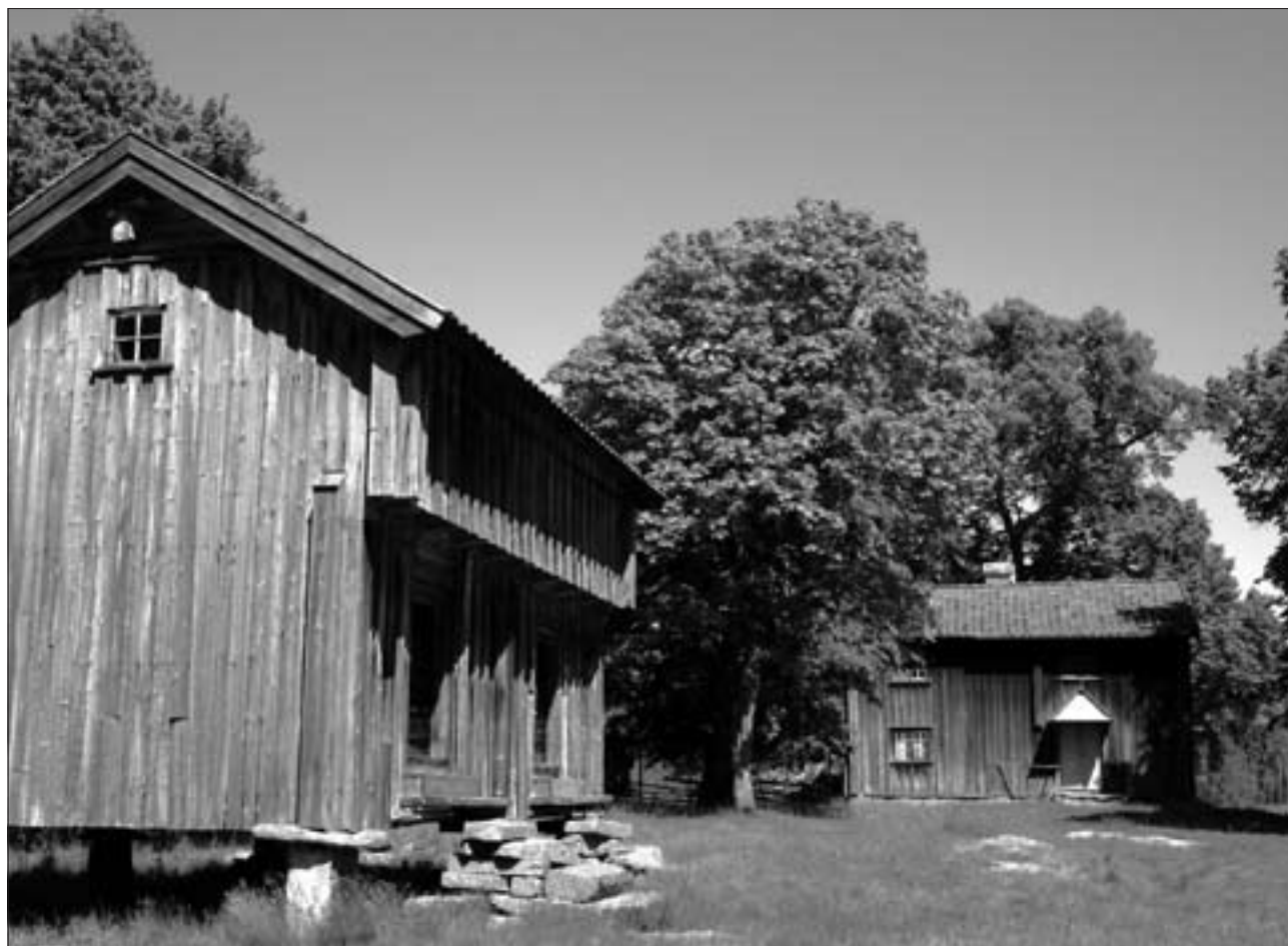
Ögårn i Dusserud

tittat in i något av dagens närmast industrialiserade djurstallar är det lilla fähuset, där båsen står utefter väggarna på gammalt vis.