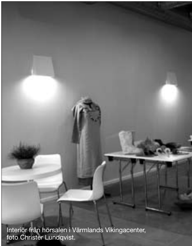
Interiör från hörsalen i Värmlands Vikingacenter, foto Christer Lundqvist.

år 1200, när det traditionella sättet att leva konfronterades med nymodigheter inom vapenbruk, hantverk och klädmode, som introducerades via stormännen och deras följn längre söderifrån.