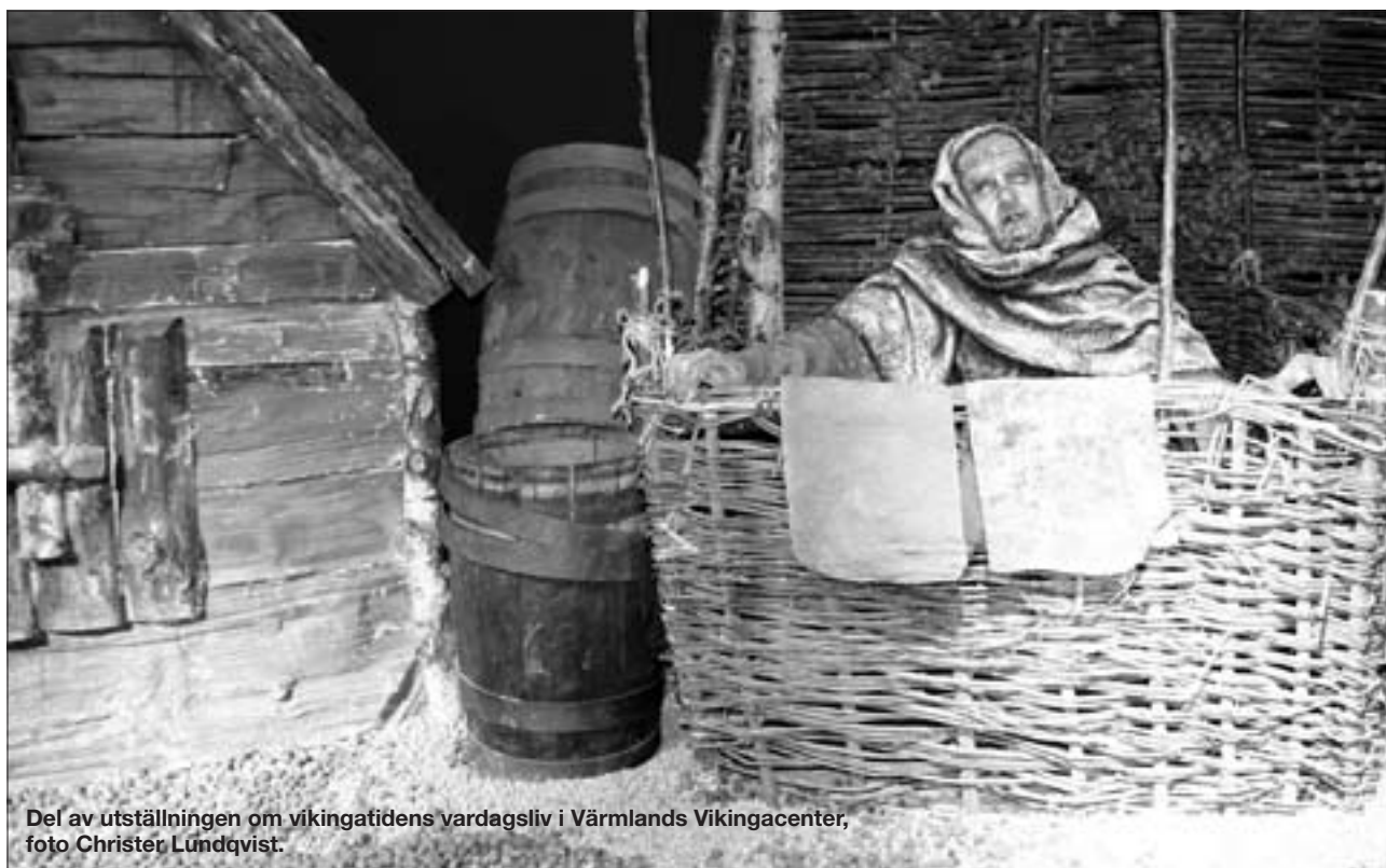
Del av utställningen om vikingatidens vardagsliv i Värmlands Vikingacenter, foto Christer Lundqvist.

center alltså blir ett dagligen öppet besöksmål från midsommartid och sommaren ut sker själva invigningen högtidligen i samband med Värmlands Vikingating, ett arrangemang i två dagar som tog sin början föregående sommar. Nu i år förvandlas området på ångarna nere vid Byälven till en myllrande, levande marknad sista helgen i juli – alltså 26–27. Då blir det utfärder med skeppet, som förhoppningsvis också får sällskap av andra forntida flytetyg. Då blir det hantverk, då blir det musik, dans och lekar för både barn och vuxna. Då blir det också besök av såväl islandshästar för prova på-ritter som av riddare inom S:t Nicolai riddareförening, som visar sina färdigheter på hästryggen med svärd och lans. Nysäter blir som det – kanske – var omkring