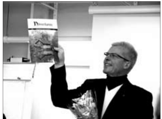
Bilder från årsstämman på Hotel FrykenStrand