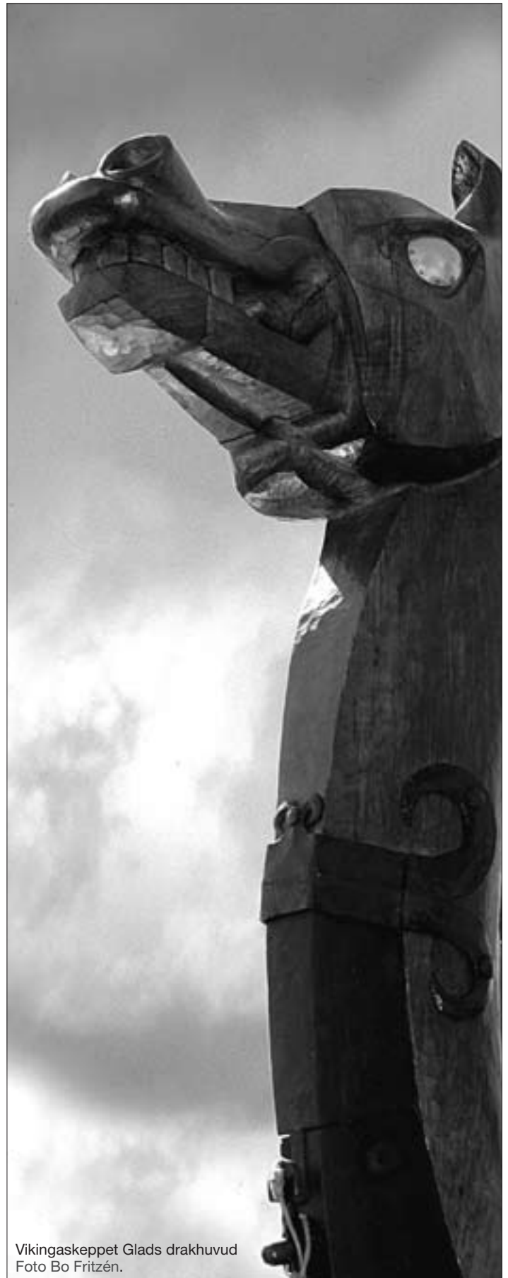
Vikingaskeppet Glads drakhuvud.

Den som vill veta mer om Värmlands Vikingacenter och Värmlands Vikingating kan kasta ett öga på hemsidan: www.varmlandsvikingacenter.se Eller ringa 0533-303 20