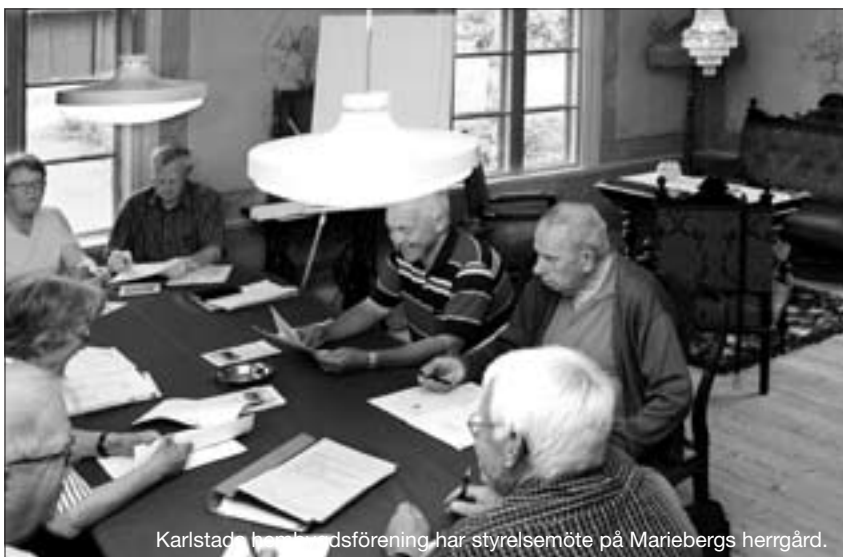
Karlstads hembygdsförening har styrelsemöte på Mariebergs herrgård.