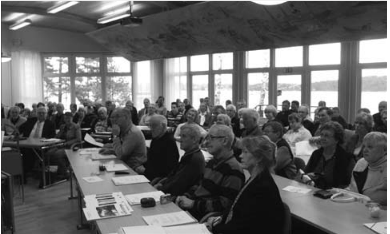
Hotel FrykenStrands konferenslokal var fullsatt.