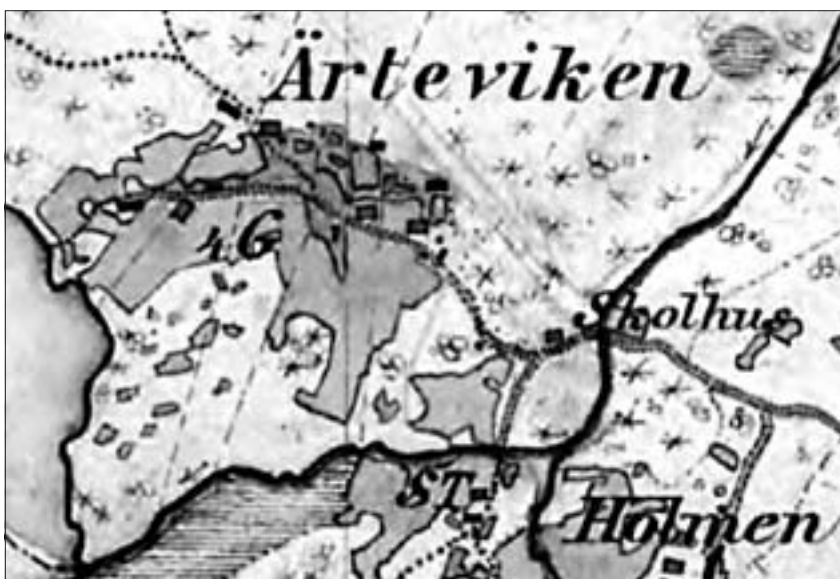
Ärtviken enligt Hembygdskartan, ca 1880–1895.