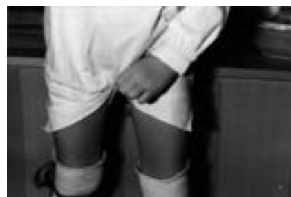
Skjortans bakstycke dras därefter framåt