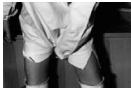
Skjortans framstycke förs bakåt mellan benen