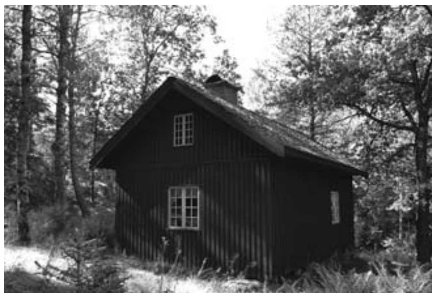
Almqviststugan i Graf i Köla.