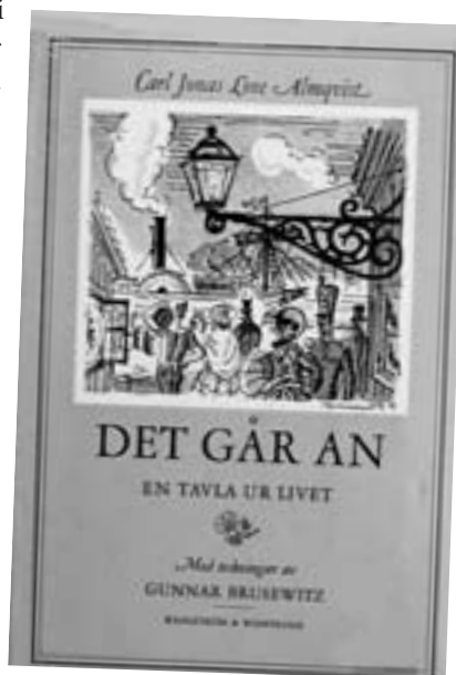
Det går an , utgåva från 1979 med illustrationer av Gunnar Brusewitz.

Almqviststugan i Graf är öppen för allmänheten varje söndag i juli månad. Därutöver visas stugan efter överenskommelse. Bland förvaldade minnessaker räknar Köla Stämman två stolar som Love enligt traditionen var ägare till när han bodde i Graf. Och naturligtvis förvaltar föreningen arkivexemplar av Carl Jonas Love Almqvists hela och stora författarskap. ☺