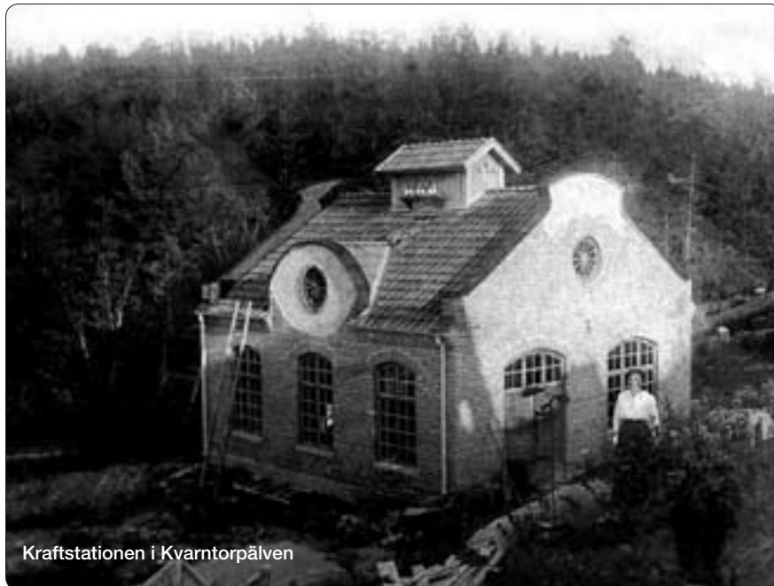
Kraftstationen i Kvarntorpälven

I år tilldelades medel för restaureringar av Ritamáki finngård, Lekvattnet och