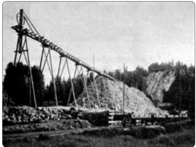
Upplag och utlastningskaj vid Limkullens kalkbrott. Notera järnvägs-vagnarna till höger. Foto Harald Carlborg 1926

Omkring 1940 gjorde Filipstadsfödde professorn i geologi, Nils H. Magnusson, en beräkning över kalktillgångarna vid Nordmarksbergs gruvor. Enligt honom erhöles då på 28 meters nivå en kalkarea av 1 760 m 2 , på 110 m nivå en area av 1 565 m 2 och på 142 m nivå även här en area av 1 760 m 2 . Sammanlagt räknade Magnusson med en kvantitet av 718 000 ton ren kalksten mellan marknivån och 142 meters nivå. På grund av närheten till gamla gruvrum så bedömde dock Magnusson den brytvärda mängden med mera än 95% CaCO 3 till ca 500 000 ton kalksten. Mot djupet verkade kalkstensmängden minska och var på 230 m nivå endast cirka 450 m 2 . Varför man endast bröt drygt 42 000 ton kalksten vid Nordmarksberg är oklart, men Uddeholms kalkbrytning i Filipstadstrakten koncentrerades till Gåsgruvan. Där fanns, och finns, betydligt större tillgångar än vid Nordmarksberg. Huvuddelen av denna kalkstensfyndighet har också brutits i dagbrott, vilket är betydligt billigare än underjordsbrytning. 🐦