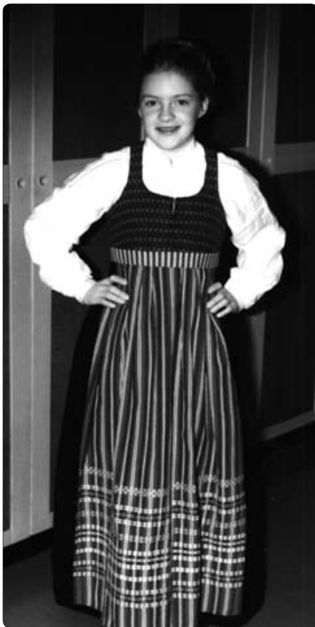
Ekshäradsflicka Plagg gjorda efter gamla förebilder

HUVUDBONADERNA får däremot inte tas av, även om det är varmt. Det vet varje ärbär kvinna, och det bör vi rätta oss efter även numera. Bilden visar en ogift kvinna klädd i en av Ekshäradsdräktens varianter. Det var ju så förr, att det fanns många varianter, men det gick ändå att se, varifrån dräkten kom. 🐦