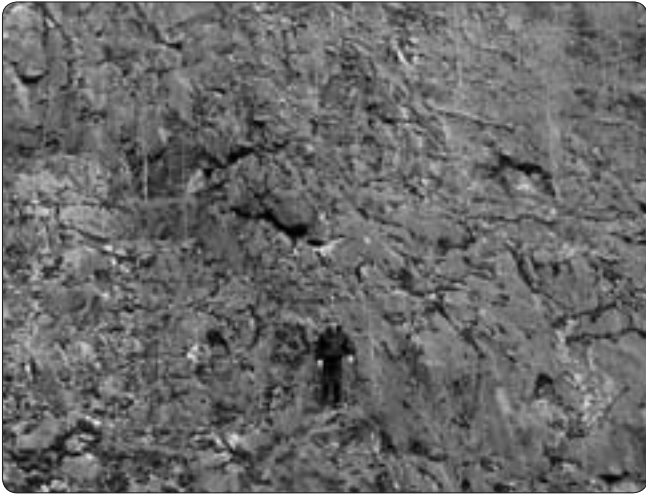
Limkullens kalkbrott år 2009. Notera personen i svarta kläder så får ni en uppfattning om storleken på bergväggen.

ligger ca 800 m ost om Nordmarks kyrka. Trots att relativt stora kalkstenspartier finns i anslutning till järngruvorna i detta gruvfält, så var det först på 1940-talet som brytning i lite större skala kom igång. Man bröt då kalk i ett s.k. magasin som tappades ur på 142 m nivå (djup) i gruvan. Magasinet låg ca 20 meter sydväst om Gubbortsschaktet. Brytningen påbörjades 1943 och redan 1945 hade magasinet drivits upp till 60 m avvägning. Där avbröts brytningen. Nästan all kalk uppförades genom Gubbortsschaktet, men från och med april 1949 transporterades kalken genom den då nyss färdigställda orten (gruvgången) på 360 meters nivå bort till Tabergs gruvor. Orten var/är ca 800 meter lång. Kalken uppförades med andra ord hädanefter genom Oscars schakt i Taberg. Detta pågick dock bara en kort tid, kalktappningen ur magasinet avslutades nämligen redan år 1950. Sammanlagt bröts 42 300 ton kalkhaltigt berg under åren 1943–1950 vid Nordmarksbergs gruvor. Kalkstenen från Nordmarksberg användes för klorkalciumtillverkningen i Skoghäll samt vid de elektriska hyttorna i Hagfors.