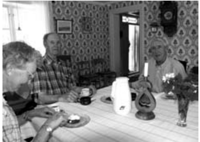
Våfflor och kaffe smakade gott i Älgå hembygdsgård