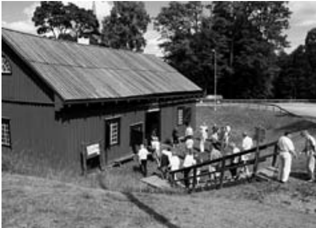
Spiksmedjan i Älgå.