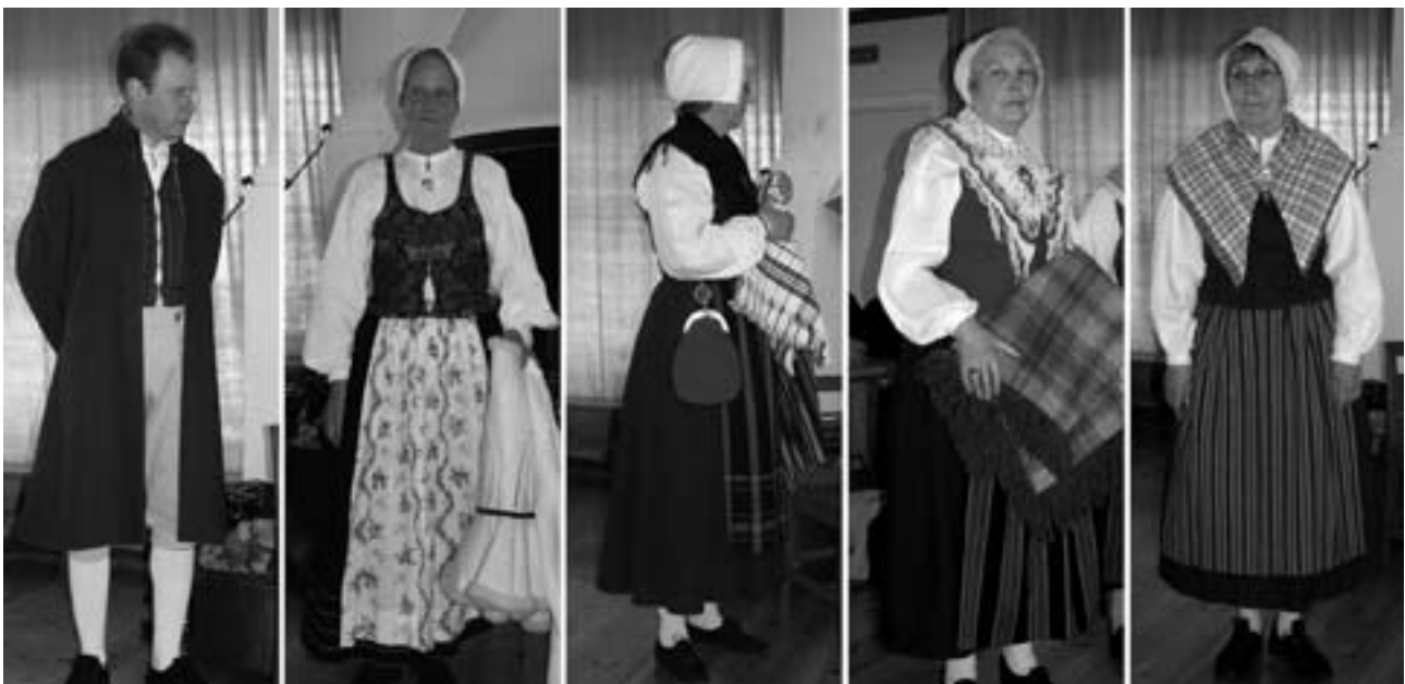
Dräktparad: Många årsmötesdeltagare hade hörsammat ordförandens begäran om att så många som möjligt skulle komma iklädda sin bygde- eller folkdräkt.

En del av oss i hembygdsföreningarna kommer att bli involverade som värdar vid besök. Syftet med konferensen är att knyta kontakter mellan länderna. Det ska bli en fortsättning på konferensen i USA om två år.