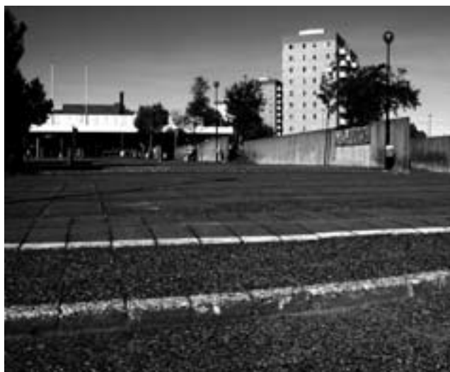
Target i Hagfors