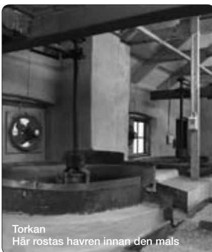
Torkan Här rostas havren innan den mals