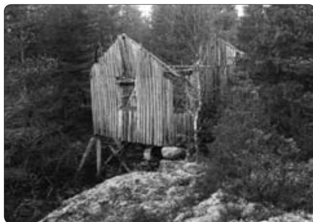
Byggnaden som hyste täljstenssvarven var i långt gånget förfall när den dokumenterades 1929.

Som nämnts inledningsvis bestod tillverkningen i Kabbehultet i huvudsak av gravvårdar och skorstenar. Att hugga en skorsten var enligt sagesmannen två mans arbete under en vecka. Gravvårdarna byggdes upp av tre block.