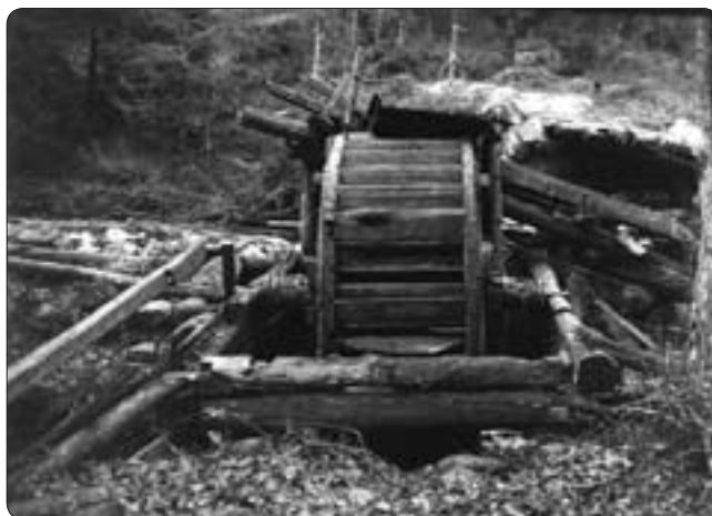
Det överksamma skovelhjulet berättar på sitt sätt att verksamheten är historia.