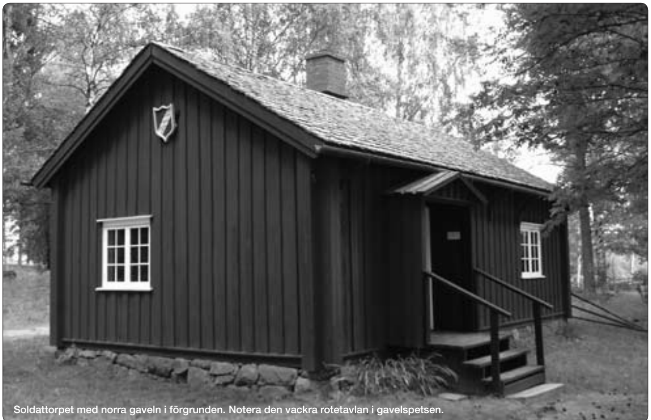
Soldattorpets med norra gaveln i förgrunden. Notera den vackra rotetavlan i gavelspetsen.