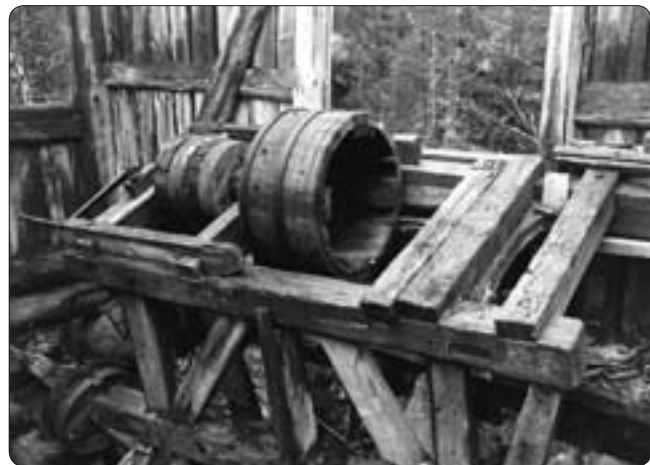
Detalj av den gamla svarven som på sin tid formade många vackra grytor i täljsten.

Sedan år 1937 har ingen verksamhet bedrivits i täljstensbrotten i Kabbehultet, varken i det södra eller norra brottet. Den hade då pågått med både längre och kortare uppehåll åtminstone sedan slutet av 1600-talet. Men brotten kan vara äldre än så. Det kan tänkas att brytningen börjat redan under medeltiden. Kanske hämtade stentjärnaren som högg och ornamenterade församlingens medeltida dopfont från slutet av 1100-talet, med hjälp av bön-