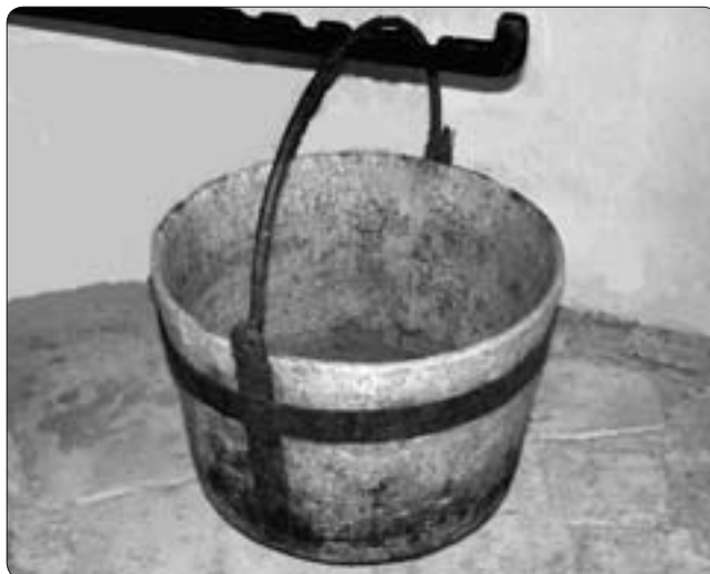
Gryta svarvad i täljsten. Nordmarksstugan i Töcksfors.

derna, stenen från något av brotten. Det ligger nära till hands att man tog hit konstnären när stenarten som den höggs i fanns inom sockengränserna.