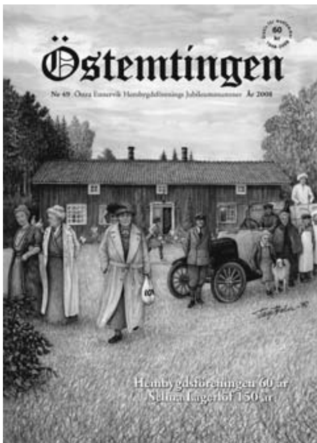
Omslaget till Östemtingens jubileumsnummer

Selma Lagerlöf hade fyllt 150 år i år, om hon hade fått leva och haft hälsan. Trots att hon dog redan 1940 är hon i högsta grad närvarande i vår tid. Böckerna blir lästa (och filmatiserade) igen och igen, vi får se Selma som teaterfigur, vi kan läsa om henne och hennes verk på större eller mindre utställningar runtom i Sverige. Inte minst fortsätter Selma – för vi är ju familjära med henne här i Värmland och känner henne via förnamn – att vara en landskapsangelägenhet. Och stolthet!