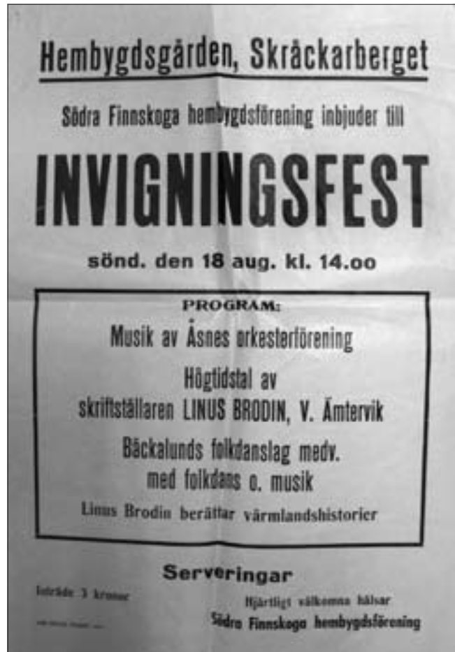
Affisch från 1957.