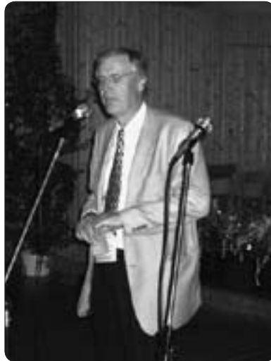
Finlands ambassadör i Oslo, Peter Stenlund, hedrade vårt jubileum med sin närvaro