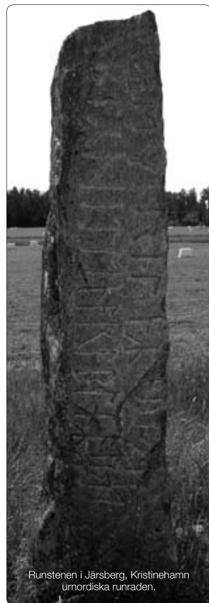
Runstenen i Järsberg, Kristinehamn urnordiska runraden.

DEN 16-TYPIGA FUTHARKEN var alltså ingen total revolution; inte mindre än tio runor övertogs praktiskt taget oförändrade från det äldre runalfabetet. Den nya runraden kom att få två huvudvarianter: "Normalrunor" och "Kortkvistrunor". De senare är något förenklade och rimligen något snabbare att "skriva". Men inte nog med det, förenkling låg uppenbart i tiden, så ytterligare en rationalisering av alfabetet kom att göras i det att man gjorde runorna helt stavlösa. Därmed hade skapats runskriftens absoluta snabbskrift (eller stenografi om man får vara så vitsig). Därutöver utvecklades också en medeltida runrad, som på olika platser i landet användes av allmogen ända in i