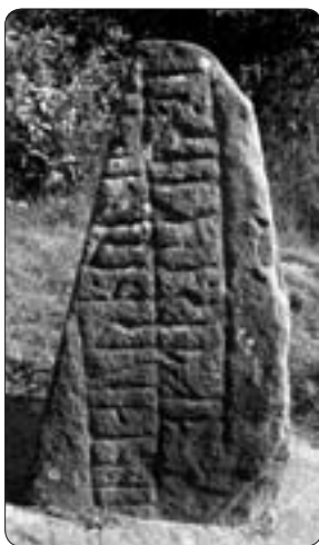
Runstenen i Hovlanda, Hammarö vikingatida runraden

Järsbergsstenen strax utanför Kristinehamn, efter vägen mot Mariestad, är också ristad enligt den äldre runraden. Det gör också denna text svårtydd men har följande uttolkning: "Jag herulen heter Uv. Ravn heter jag som runorna ristade".