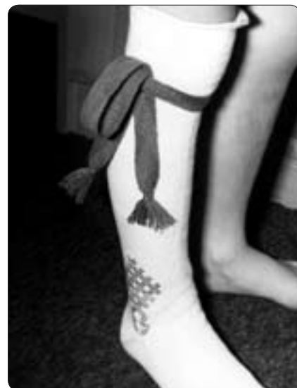
Bomullsstrumpa och strumpeband

Se bilder av en mansstrumpa från Ekshärad och hur strumpeband knyts. Knytningen är lika för män och kvinnor. Männens strumpeband ska sitta runt strumpan och följaktligen under byxans nerkant. 🐾