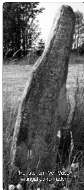
Runstenen i Ve i Väse vikingatida runraden