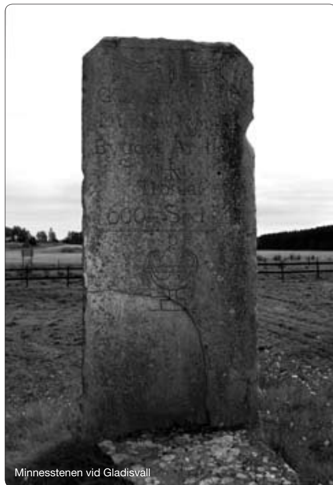
Minnesstenen vid Gladisvall

Men kung Håkon och hans folk drabbades också av en riktig olycka. För vintern var som sagt mycket sträng