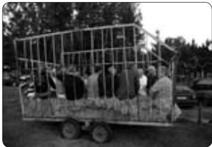
Färdsätten till Bonnrock har ofta agrikulturell anknytning.

som förvaltas av hembygdsföreningen och arkivet kommer att öppnas för allmänheten i slutet av september. Under våren har en nålbindningskurs genomförts på hembygdsgården Ås Brunn, där entusiastiska kursdeltagare har invigts i nålbindandets konst.