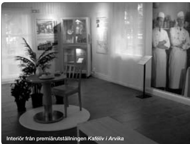
Interiör från premiärutställningen Kaféliv i Arvika

finns den stiliga interiören från Bergenholtz år 1907 och de tre konditorerna bredvid sina gesällprov från 1945, uppförstorade till nästan naturlig storlek. En av dem har berättat om sina erfarenheter från ett långt yrkesliv och lånat ut föremål. Det äldsta kaféet som fortfarande finns kvar, Nordells, har lånat ut såväl kakfat och kannor som bord och stol. Privatpersoner har frikostigt hjälpt till med föremål,