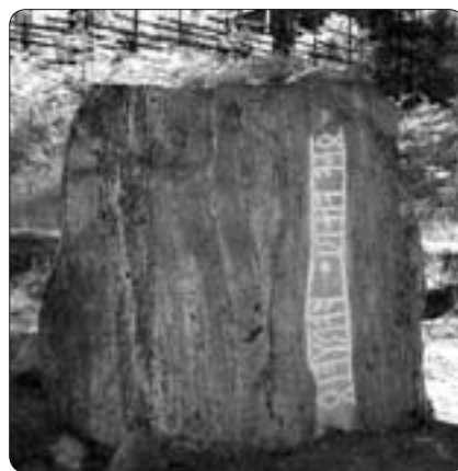
Runstenen i Gunnarskog, urnordiska runraden