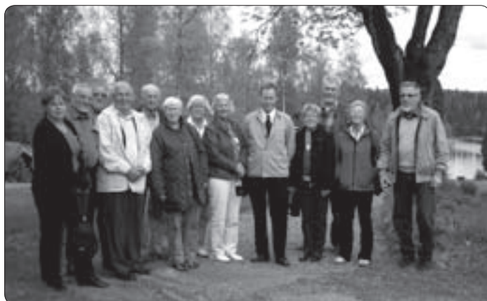
Visningsresans deltagare vid besöket på Kärnåsen. Läs Monica Karlssons referat på sidan 11.

2 november är manusstopp för nummer 4 skicka manus till: kansliet@hembygdvarmland.se