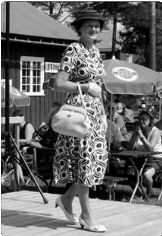
Gammelvalas årligen återkommande Dräktparaden röntte stor uppskattning även i år

När vi sammanfattar Gammelvala så gick det förvånansvärt bra tack vare en tålig publik i regnkläder, stövlar och med paraply. Gammelvalaarbetarna är otroligt slitstarka, arbetsvilliga och gladlynta och det ger en positiv stämning. Vi kunde konstatera, att vi ökat antalet betalande med 2 000 personer jämfört med i fjol. Och mest