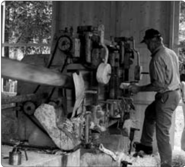
Trällmaskinen i Brunskog. Trällullen röntte stor efterfrågan, främst från alla som odlar jordgubbar

ler, 4 500 hamburgare med bröd eller mos och 4 000 korv med bröd.