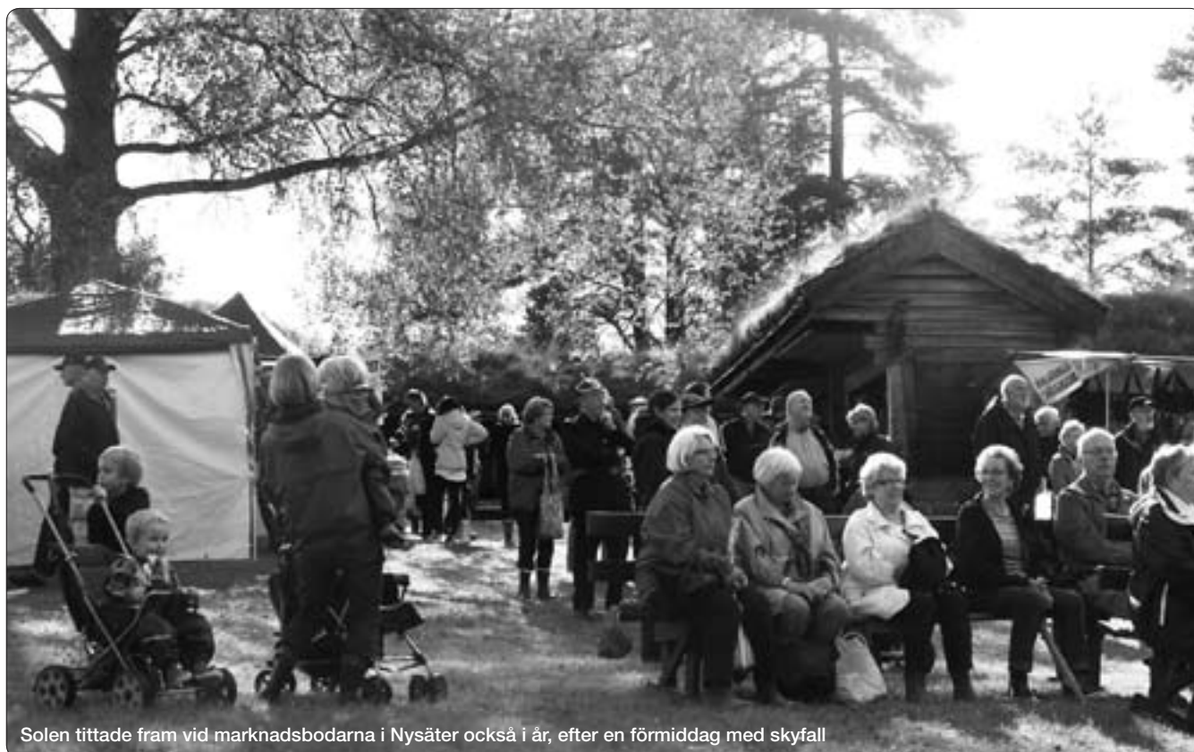
Solen tittade fram vid marknadsbodarna i Nysäter också i år, efter en förmiddag med skyfall