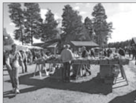
Höstmarknad i Brunskog