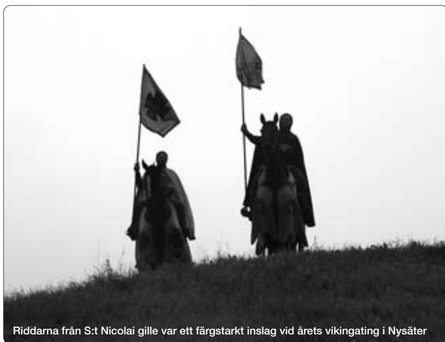
Riddarna från S:t Nicolai gille var ett färgstarkt inslag vid årets vikingating i Nysäter

För den som är intresserad av att göra en tidsresa och bekanta sig med en annan slags hembygdskultur är det bara att ta kontakt med Föreningen Vikingaleden. Det mesta kan ordnas. Och nästa år blir det nya nappatag på lekvalLEN i Gladhem och nya eldar att tända, kring vilka de som vill höra sagor kan samlas. 🐉