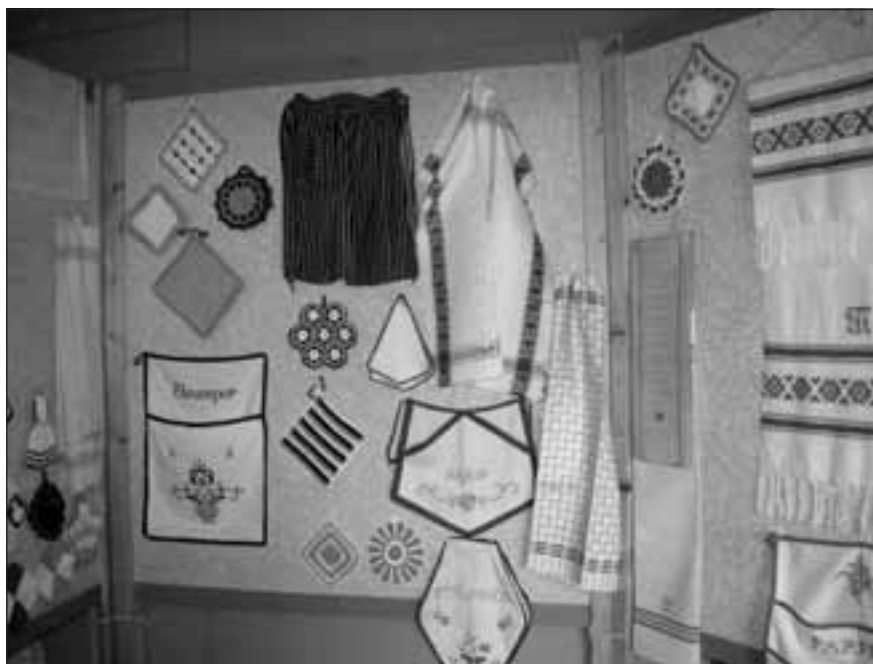
Delar av textilutställningen som visar att även enkla bruksföremål ofta var vackert och omsorgsfullt arbetade.

NÄSTA BEGIVENHET är det traditionella pannkakskalaset som äger rum i älgjaksveckan, närmare bestämt på kvällen fredag den 12 oktober. Då blir det rårakor för hela slanten! Lördag den 8 december blir det julmarknad med försäljning av det mesta som hör julen till, som exempelvis hemlagade kött- och potatiskorvar, kransar och bröd. Välkommen till Valborgsgården i Ljusnäs! 🐾