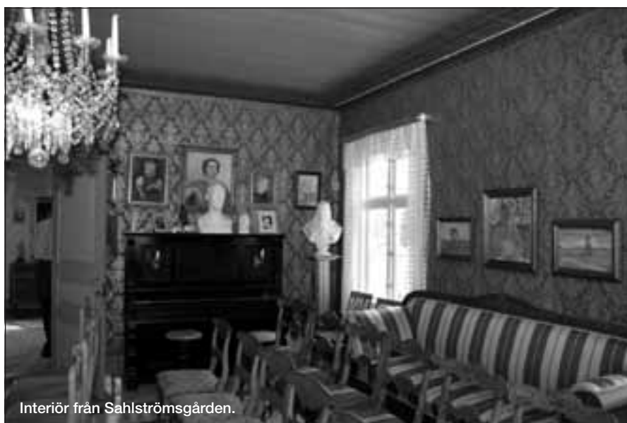
Interiör från Sahlströmsgården.

Aktivitetdagen avslutades 16.30 med dragning i medlemslotteriet. Alla som betalt sin medlemsavgift senast under aktivitetdagen deltog i lotteriet med sitt medlemsnummer. Vinsterna i lotteriet utgjordes av konst- och konsthantverk till ett värde av 30 000 kronor. Sedan ett antal lyckliga medlemmar hade mottagit sina vinster kunde Sahlströmsgårdens Dag summeras som en välbesökt och trivsamt tillställning, i ett – för den här sommaren – ovanligt vackert väder. ☺