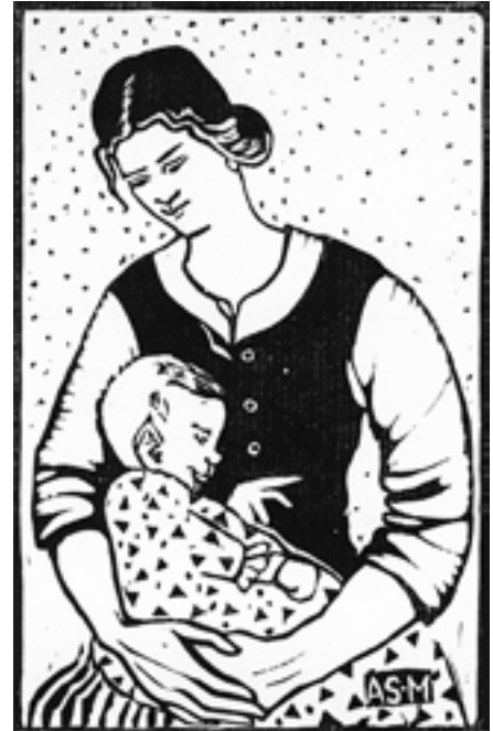
Träsnitt gjort av konstnären Anna Sahlström.