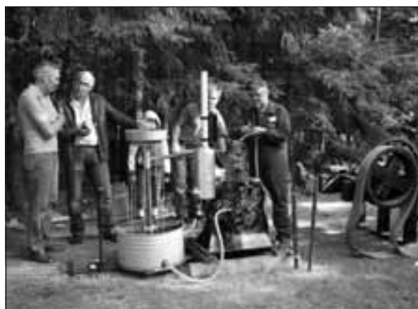
Förberedelser för start av Seffle-motorn.