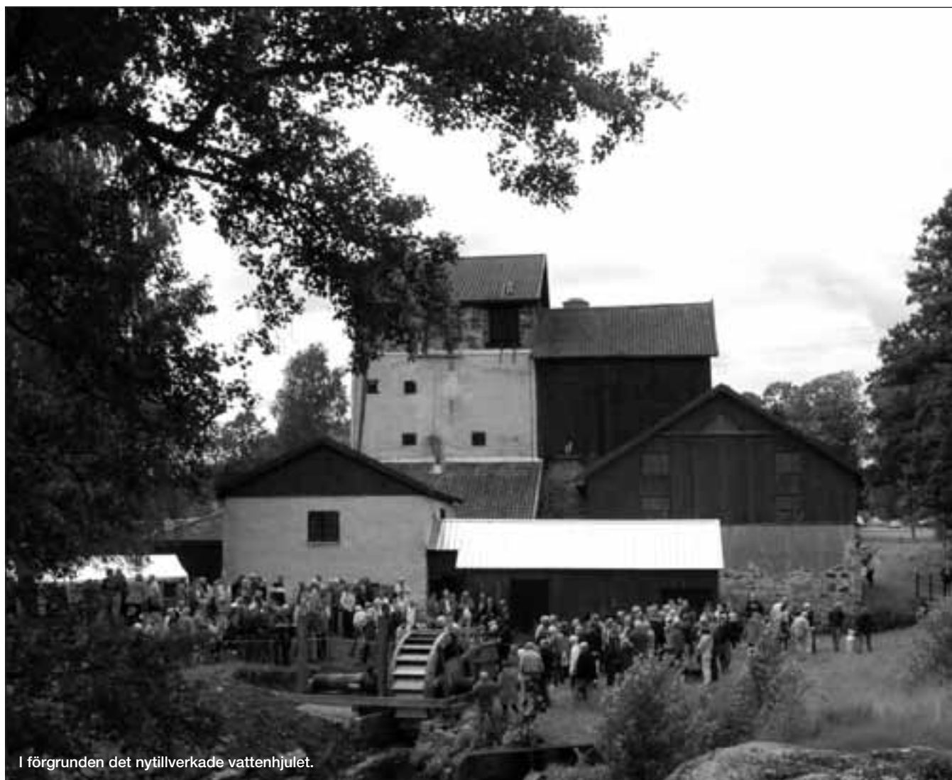
I förgrunden det nytillverkade vattenhjulet.