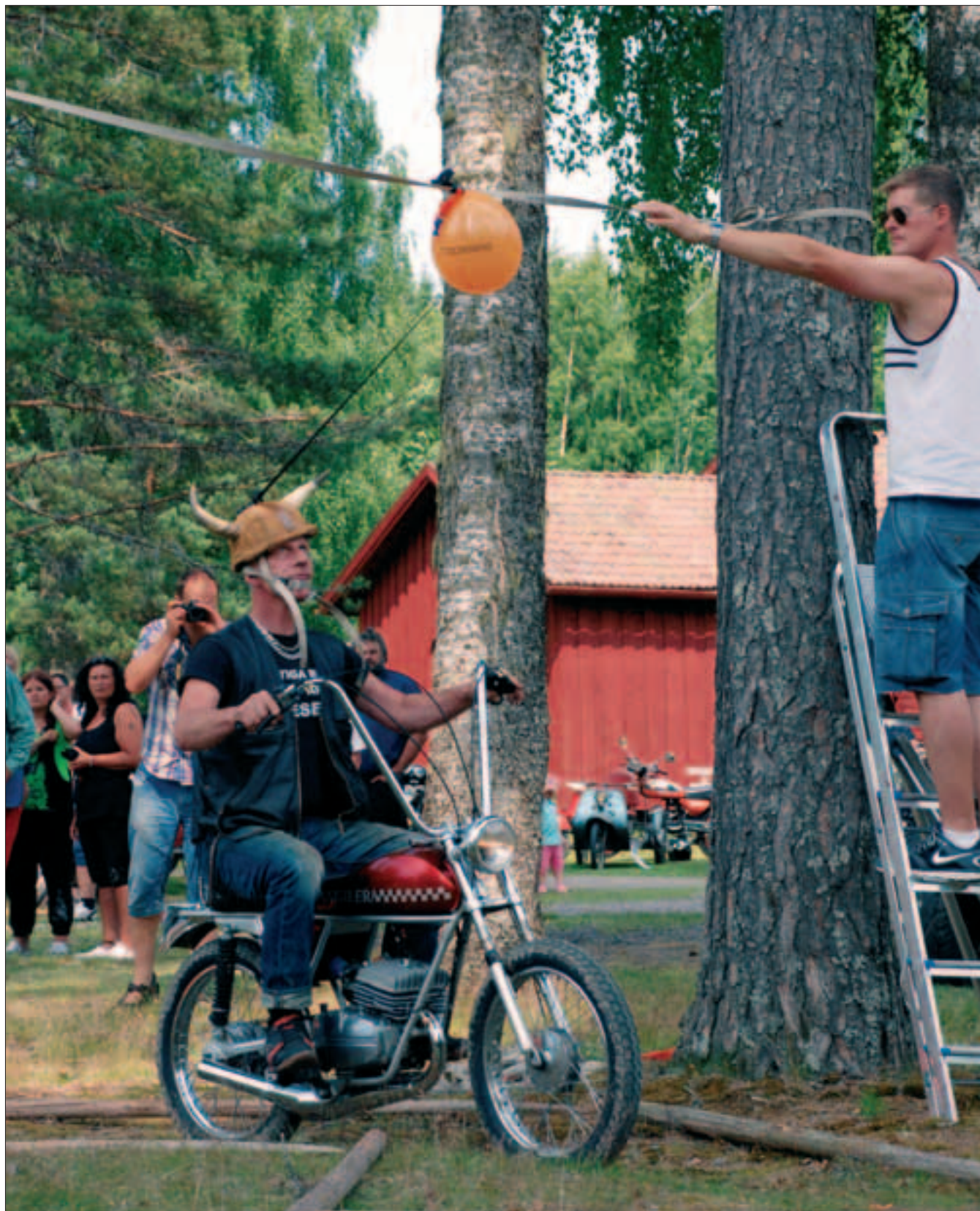
Ett delmoment i Ämtreviks mopedgilles mopedrally var att panga ballong.