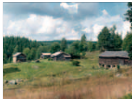
Ritamäki finngård.