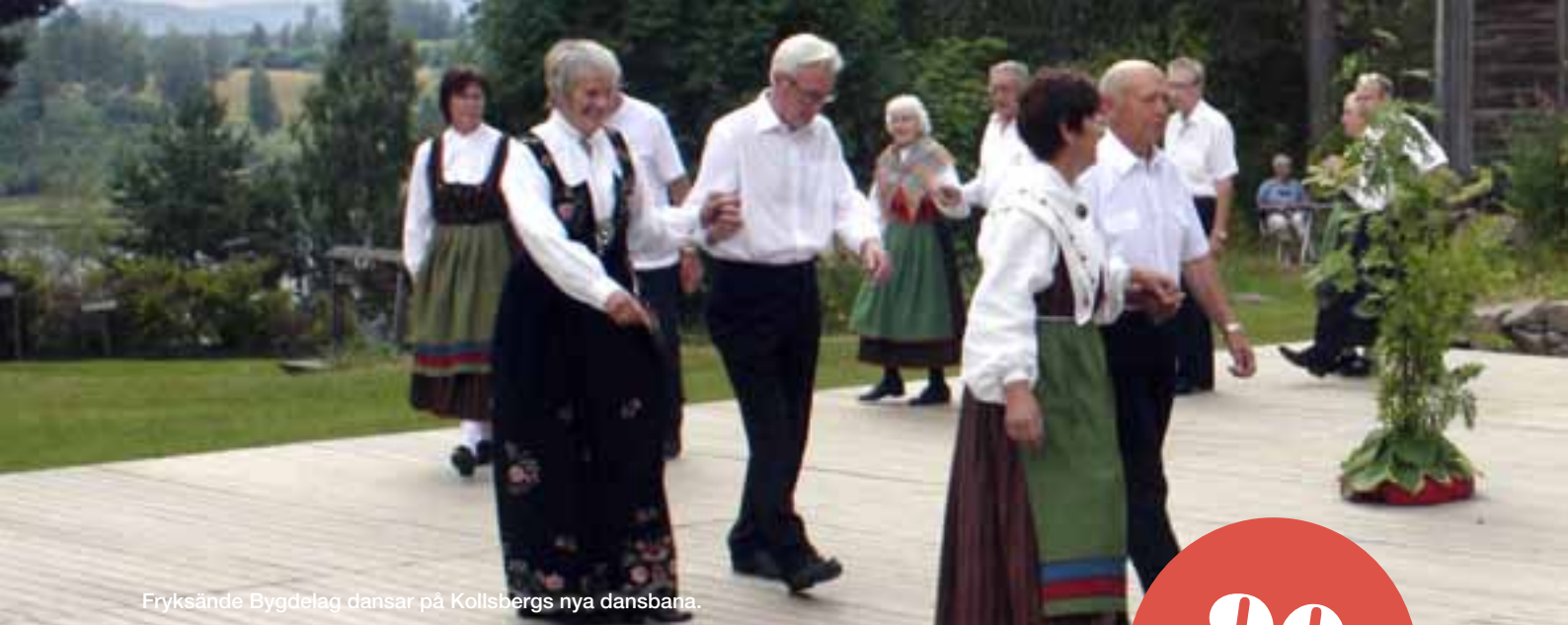
Fryksände Bygdelag dansar på Kollsbergs nya dansbana.