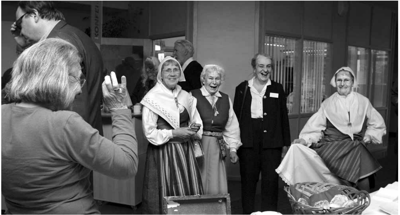
Karlstads hembygdsförening serverade kaffe och visade underkjolen.

I övrigt erbjöds under de olika kvällarna ett synnerligen förnämligt underhållningsprogram i samband med måltiderna. Gundegabaletten, Clavinovakören, Silva Musica, Ransåtersensemblen med ett avsnitt ur Värmlänningarna, Bjurtjärns Teaterförening med ett sammandrag av De sålde sina hemman är bara exempel. Detta plus välgjorda arrangemang, förstklassig mat och servering, samt inte minst den goda stämning som märktes överallt, det samspel som fanns mellan arrangörerna och det glada och öppna mötet mellan representanter för båda kontinenterna bidrog till ett mycket lyckat slutintryck.