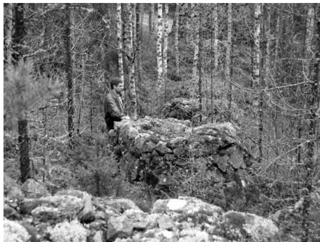
Öster om den s.k. Pyramiden, ligger ett flertal stånggångsrösen på rad i skogen.

Carlborg – Magnusson, Nordmarks Malmtrakt 1929