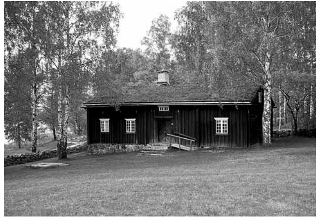
Tangengården från Långlanda i Eda socken, en typisk bondgård från 1700-talet, flyttades till Sågudden 1928.