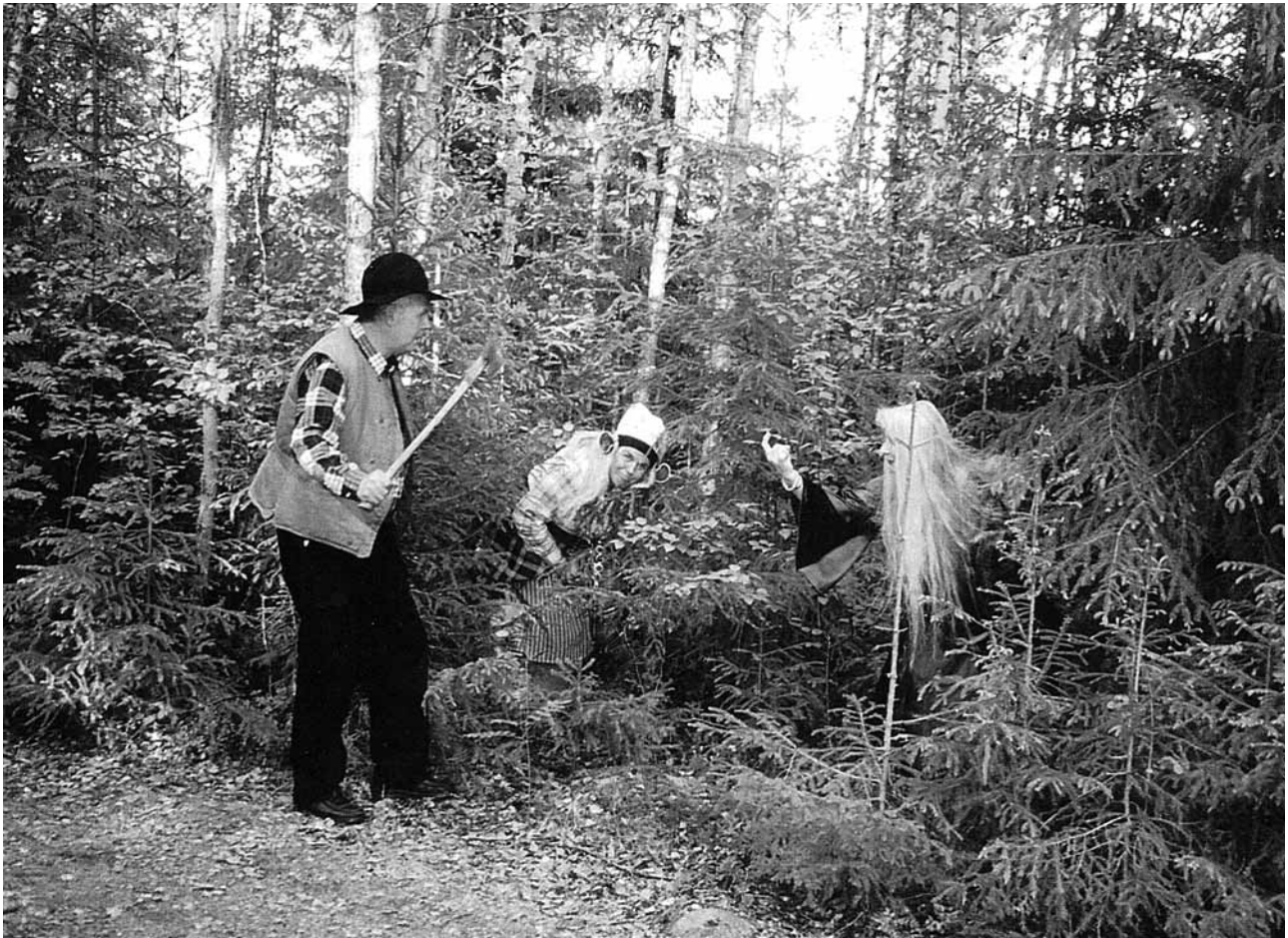
På en vandring efter Sagostigen vid Kollsberg möts man ofta av oväntade överraskningar.