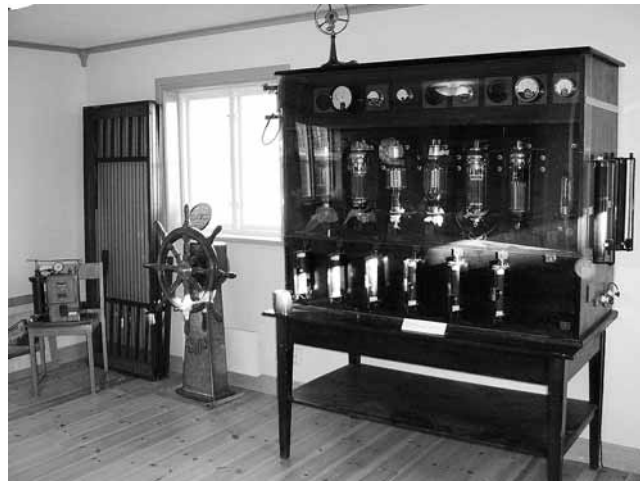
Industrimuseet på Säffle hembydsgård