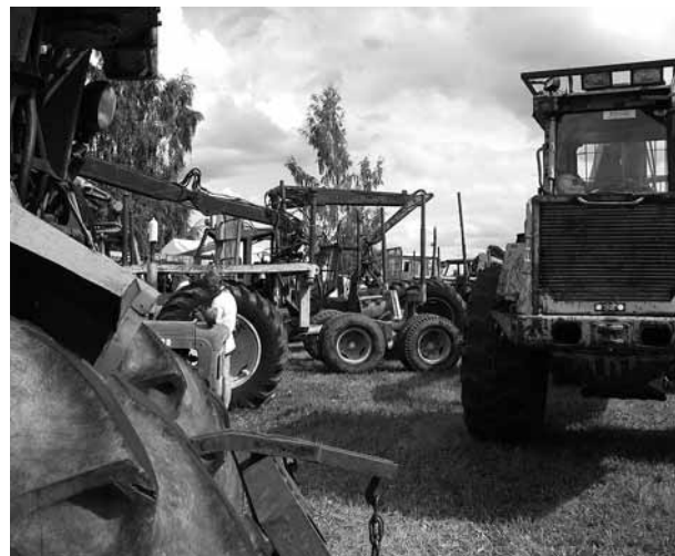
Den här avdelningen representerar lilla julafton för entusiasterna!