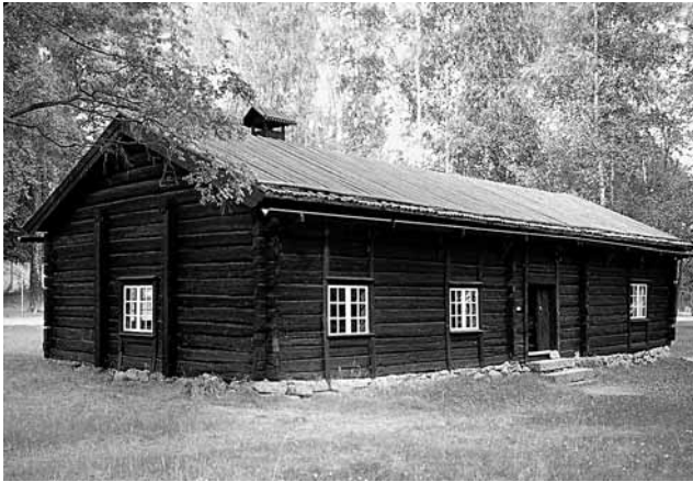
Rökstugan kommer från Spettungen i Lekvattnet och uppfördes 1915 på sin nuvarande plats.