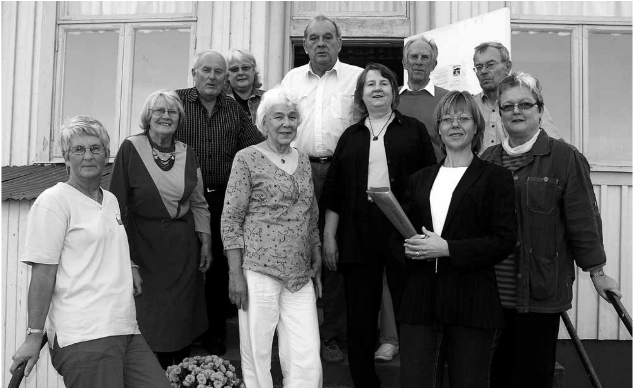
Kommungruppernas representanter samlade vid projektkontoret i Krokbäcken.