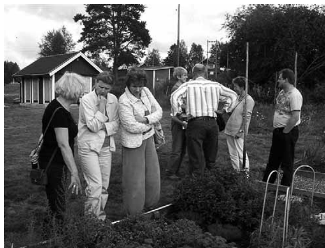
Örtagården vid hembygdsgården i Östervallskog.

Vi ska vara med i ett EU-projekt. Vi ska "få pengar" till toaletter via detta projekt, det var så vi såg det "få pengar" allt ideellt arbete, egenavgifter, arbetskraft, material m. m. det ordnar sig.