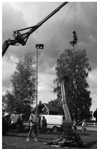
32 drickbackar, dagens rekord!