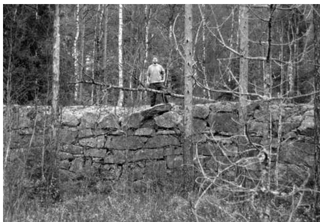
I dag återstår rester av dammuren, som består av stora block i natursten.