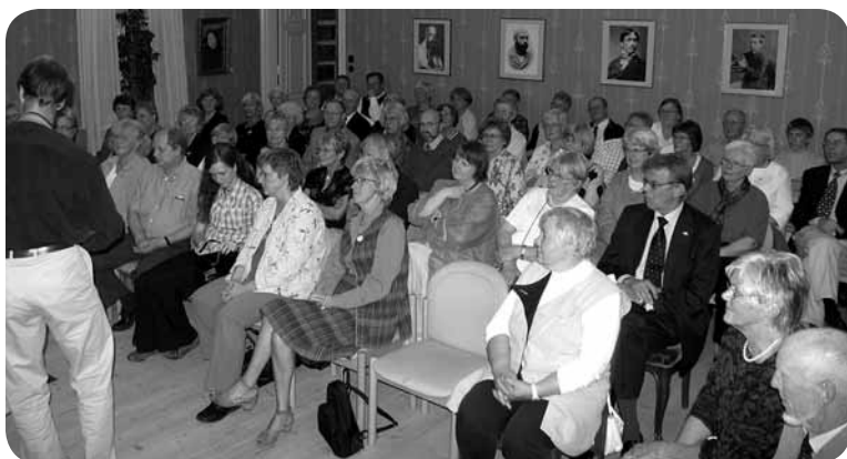
Hemslöjdens Dag, firades på Alsters Herrgård.