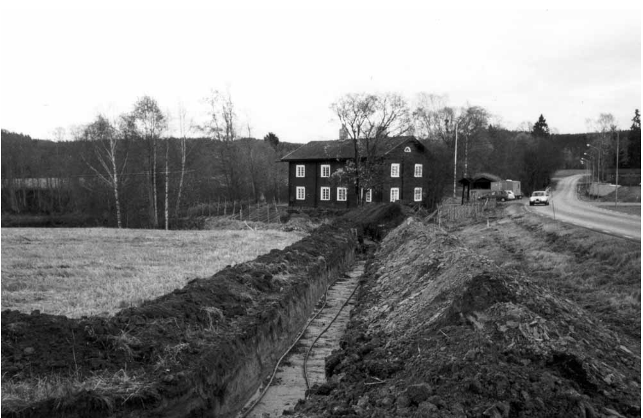
Slangläggning 23-24 oktober 2004 för installation av jordvärme på Gubbkroken.

Bytet av uppvärmningssystem från el till jordvärme har halverat uppvärmningskostnaderna samtidigt som det bidrar till en bättre miljö. Ett arbetsrum och ett pentry i bottenvåningen på Gubbkroken har gett en bättre arbetsmiljö och en toalett har handikappanpassats. Hembygdsgården har dessutom ramats in av en 250 meter lång gärdsgård.