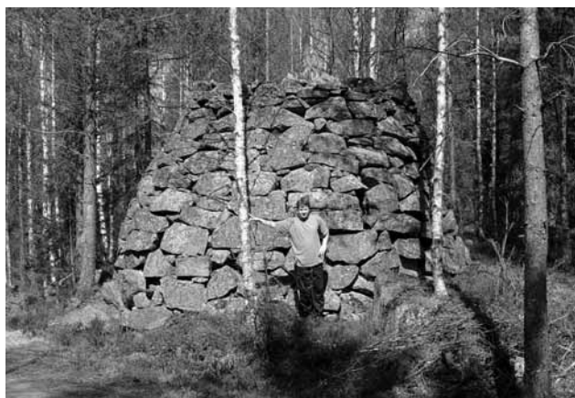
I dag används Pyramiden som jaktpass av jägarna i området.