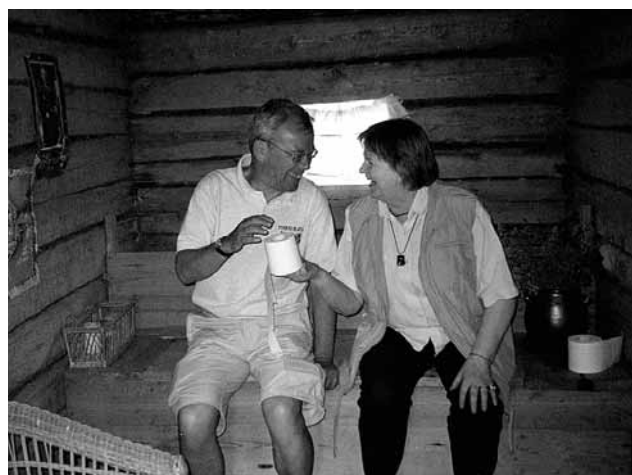
"Skitsnack" under en rundresa bland Kulturturismens hembygdsgårdar.