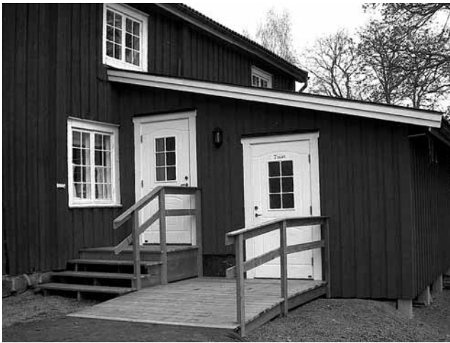
Svanskogs hembydsgård. Förråd och handikapptoa.