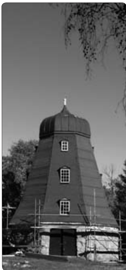
Hättkvarnen i Herrestad, Botilsäter. Kvarnen har varit föremål för renoveringsarbeten under 2009

Källor: Bl. a. Varis Bokalders, Sven B. Ek, Arvid Ernvik, Ernst Manker och Dag Midböe.