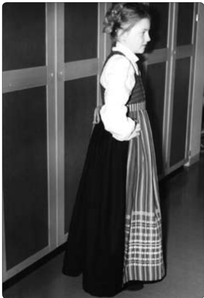
Ekshärad. Klädsel för ogift kvinna. Livkjol med munkabältesliv. Förkläde, bomull, med munkabälte