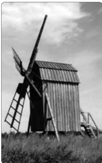
Stolpkvarn på Öland

holkkvarnen och hättkvarnen (även kallad holländaren). Stolpkvarnen och holkkvarnen räknas typ- och utvecklingsmässigt till våra äldre väderkvarnar. Hättkvarnen blev sista steget i väderkvarnens utveckling och historia. Såväl holkkvarnen som hättkvarnen anses ha sitt ursprung i Holland. Hättkvarnen var överlägsen de tidigare kvarnarna vad gällde såväl konstruktion som effektivitet. När det gällde nybyggnationer av kvarnar mot slutet av väderkvarnsepoken var hättkvarnen/holländaren den helt dominerande. Som framgått inledningsvis har även väderkvarnen en lång historia. Men den verkliga storhetstiden för väderkvarnarna i vårt land ligger inte så väldigt långt tillbaka i tiden, ungefär från mitten av 1700-talet till in i 1900-talet.