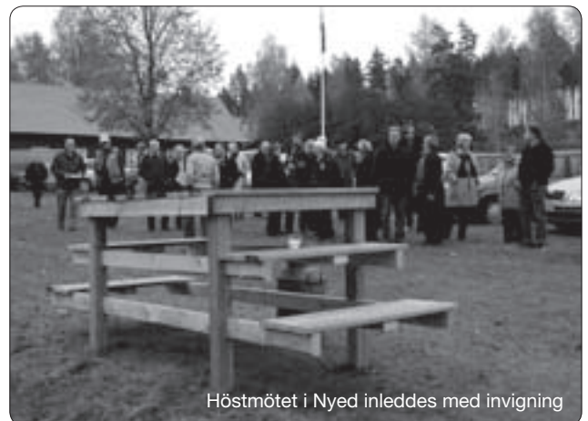
Höstmötet i Nyed inleddes med invigning

25 januari är manusstopp för nummer 1, 2010 skicka manus till: kansliet@hembygdvarmland.se