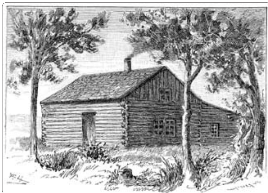
Ett timrat nybygge någonstans i Amerika

Som wi lågo uti hvarsin bädd, ämnade jag göra henne det sprattet för hennes huglöshet, att smygga mig bort, utan att taga afsked, som hon besatt den meriten, att wara både qwällsömning och morgonsömning. Dock bedrog jag mig denna resan häri ehuru jag uppstod klockan två på morgonen den 23 Maj 1853. Resan skedde till fots med ränsel på ryggen till Otterbol i Gillberga, der jag tog mig gästgivare skjuts och anlände på afton till Åmål, der jag tog mig nattlogis hos tractören Bergström. Den 24:de anlände jag i skymningen till Wenersborg, der jag gick om bord på en ångare samt ankom den 25:te till Göteborg. Intog logis hos en Schåare