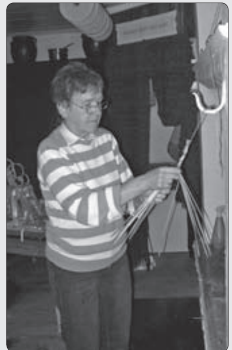
Julförberedelser på Kollsberg

PlusGiro 512602-4 Bankgiro 5666-5516 Org. nr. 873200-7706