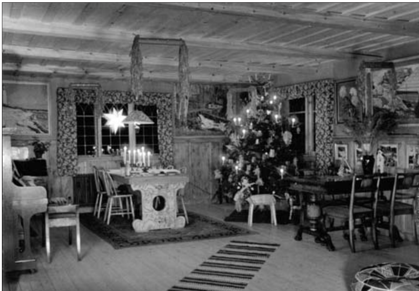
Storstugan julen 1944.