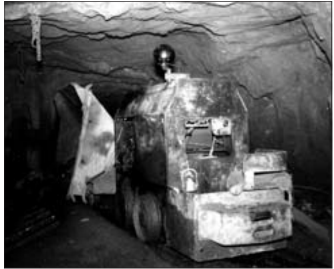
Vagnstämning vid störtschakt med ett av de fyra Inselloken i Tabergs gruva.