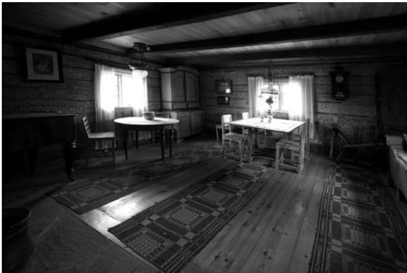
Björka gård, Östra Fågelvik. Kaptensbostället för Alsters kompani.