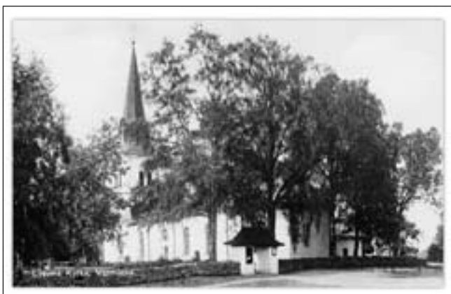
Lysviks kyrka.

samt: tfn 0225-501 90, harald.henrysson@tele2.se 🐣