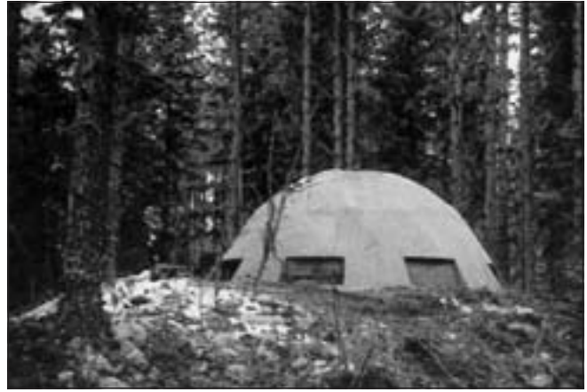
Skans någonstans i Värmland.