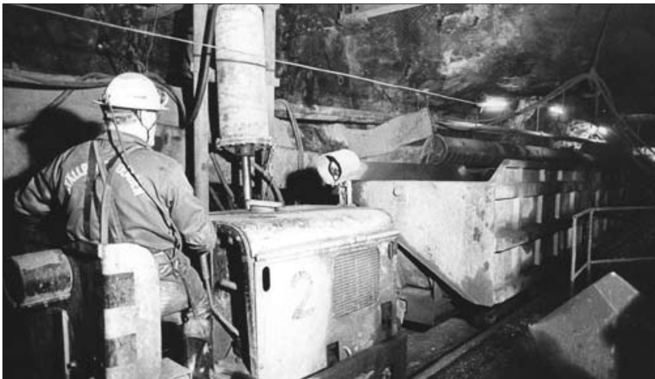
Gösta Backelin (1934–1999) på 390 m nivå ovanför krossen. Loket är ett JW 15 eller 20. ca 1978.