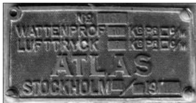
Skylt på luftbehållaren till luftloket, som visar tillverkningsår m. m.

nr 4911 och 4920, varav det sistnämnda innan hade använts vid Persbergs järngruva en kortare tid. De fyra loken var alla tillverkade av ovan nämnda Industriediesel och var av typen Insel A 10. Loket vägde 2,7 ton och hade en motoreffekt av 9–10 hk, samt drevs av en engelsk Lister-motor. Spårvidden var 750 mm. Enligt Lars Carells monografi över Taberg från år 1954 (KTH) så användes loken då på följande ställen i Tabergs gruvor: ett lok på 80 meters nivå i den s.k. Dyviksmalmen, ett annat på 350 m nivå och på 390 m nivå. På sistnämnda nivån så gick två lok, varav ett betjänade Nordmarksbergs gruvor genom den nyss nämnda 700 meter långa orten. Dessa fyra lok var i drift fram till nedläggningen 1962, då tre av loken överfördes till järngruvan i Persberg. Nr 4913 sparades dock