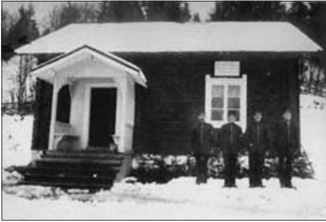
Fyra knektar i enskild ställning framför ett soldattorp med skylten "Kungl. Wermlands Regemente. Efldals kompani Nr 14".

och Wermlands Regemente totalt 1 674 indelta soldater varav 1 200 var bosatta i Värmland. Efter delningen var kvarvarande antalet soldater vid Wermlands Regemente (I 22) 908 soldater, fördelade på åtta kompanier och de bodde i huvudsak väster om Klarälven. Indelningsverket upphörde 1901 i samband med att värnpliktslagen infördes.